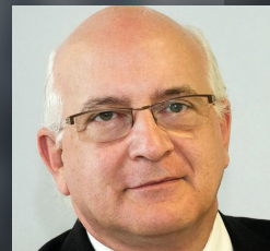
JAVIER ZARZALEJOS Eurodiputado del Grupo Popular Europeo.