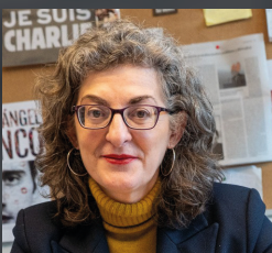
MAITE PAGAZAURTUNDÚA Eurodiputada del Grupo Renovar Europa.