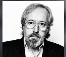
JUAN CARLOS GIRAUTA Candidato de Vox al Parlamento Europeo.