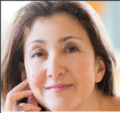
INGRID BETANCOURT Víctima del terrorismo y exsenadora de la República de Colombia. Premio Princesa de Asturias a la Concordia 2008.