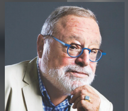
FERNANDO SAVATER Filósofo y escritor.